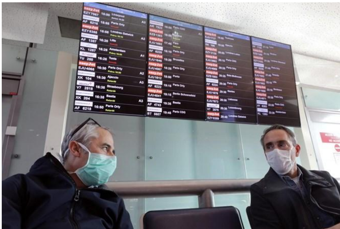
Imagem do mês