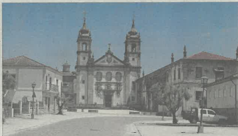
Coberturas e fachadas da Igreja do Mosteiro começarão a receber obras num valor estimado em 506 mil euros

“Reconhecemos que a intervenção na Igreja era a prioridade das prioridades e batemo-nos sempre pela realização das obras, sob pena de se perder todo o património valiosíssimo deste Mosteiro. Por isso, naturalmente que recebemos esta notícia com enorme alegria e muita satisfação”, disse ao