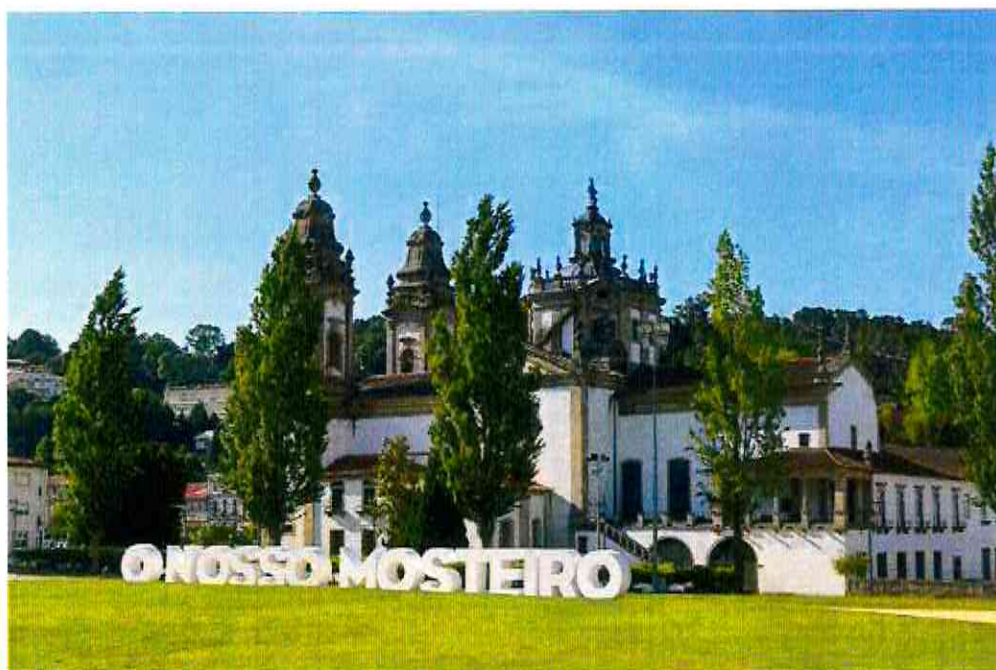
Mosteiro de São Miguel de Refojos vai ter passe-partout digital.

No âmbito do programa cultural ' Mosteiro de Emoções ' vai ser criado um passe-partout, ou seja, uma Coleção de Postais digitais alusivos ao Mosteiro de São Miguel Refojos . Uma coleção que é criada sob várias perspetivas e linguagens artísticas, através do olhar de artistas exteriores ao concelho de Cabeceiras de Basto .