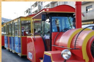
Comboio Turístico com o Pai Natal

Desporto | Tempos Livres | Lazer | Exposições | Iniciativas Socioculturais | Tradições | Usos e Costumes