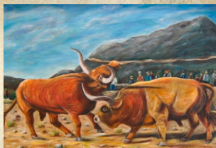
Chegas de Bois de Natal

Org. | Câmara Municipal de Cabeceiras de Basto Basto Vida