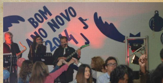
31 Passagem de Ano Casa da Juventude Org. | Basto Vida Colab. | Câmara Municipal de Cabeceiras de Basto