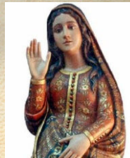
16 Missa em Honra de Nossa Sra. do Ó Olela - Basto Org. | Comissão Fabriqueira - Paróquia