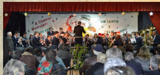
21 Festa de Natal Concelhia Casa da Juventude Org. | Basto Vida Colab. | Câmara Municipal de Cabeceiras de Basto