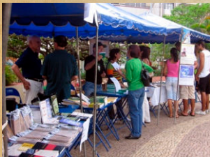
15 Feira de Sta. Luzia Arco de Baúlhe